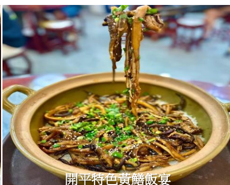
開平特色黃鱔飯宴