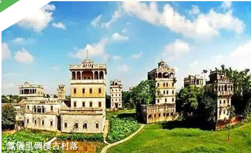
鳳儀里碉樓古村落

※專業貼心服務~全程食住玩安排妥善、預留充足自由活動時間令團友盡情享受 ※【當地專屬配車，由經驗充足的服務人員同行下，讓您體會一個舒適安心的旅程】