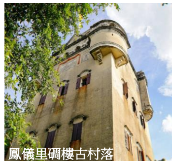
鳳儀里礪樓古村落

早上 08:00 羅湖口岸集合 (原口岸餐廳門前廣場)，09:00 深圳灣口岸集合 (口岸門前廣場)，乘坐國內旅遊巴士經深中通道前往陽江，午餐品嚐【五邑陳皮水鴨湯宴】，餐後提前入住酒店 (放下行李，簡單梳洗，更方便晚上看完演唱會可以儘早回酒店休息)，晚餐品嚐【馳名白切雞+陽江豆豉宴】。20:00於陽江市體育館觀看【巫啟賢 (2024) 巡迴演唱會·紅塵來去夢太傻】(重本包價值¥388門票) 120分鐘現場大樂隊伴奏，華人世界超級唱將，演唱會後返回酒店、自由活動。