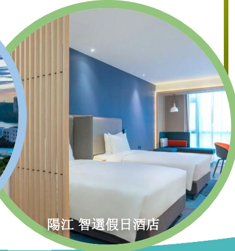
陽江 智選假日酒店