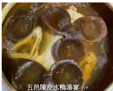
五邑陳皮水鴨湯宴