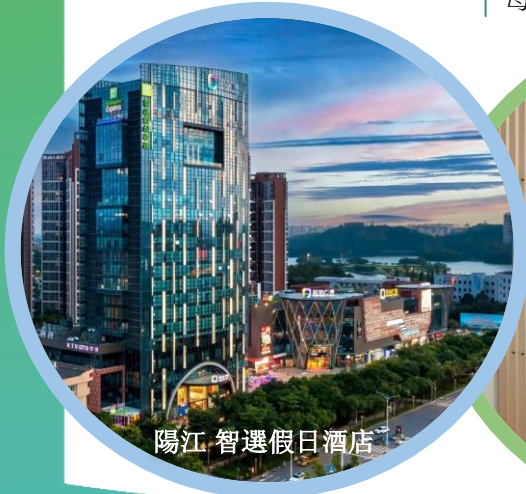
陽江 智選假日酒店